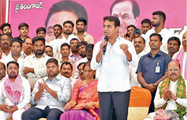
బీఆర్ఎస్ ప్రజాప్రతినిధుల సన్మాన కార్యక్రమంలో మాట్లాడుతున్న బీఆర్ఎస్ వర్కింగ్ ప్రెసిడెంట్ కెటిఆర్