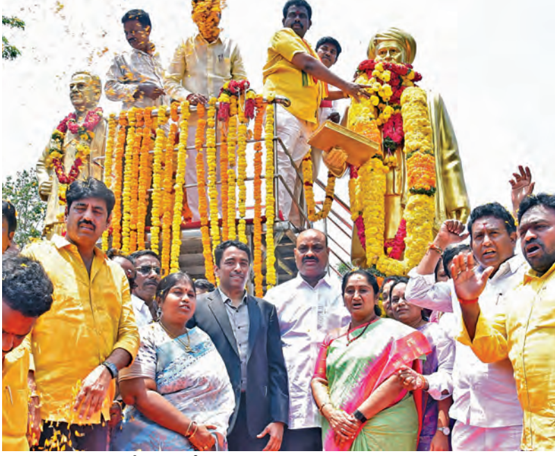
శనివారం మహారాష్ట్ర జ్యోతిబా పూలే జయంతినందర్లంగా ఆయన విగ్రహానికి నివాళి అర్పిస్తున్న మంత్రులు