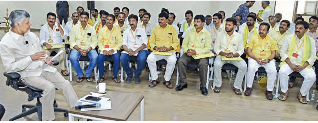
శనివారం టిడిపి కార్యకర్తల శిక్షణ కార్యక్రమంలో పాల్గొన్న సింఘం చంద్రబాబు నాయుడు

పాల్గొనేతలు, కార్యకర్తలకు సింఘం చంద్రబాబు సలహా పాల్గొ బలోపేతానికి 'ఇ-3' కార్యక్రమం ప్రభుత్వం కష్టాలు ప్రజలకు వివరించాలి