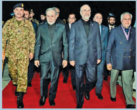
చర్చలోనే పాక్ వచ్చిన ఇరాన్ ప్రతినిధుల బృందం

ఇస్లామాబాద్ లో 'అమెరికా, ఇరాన్ మధ్య తొలిరోజు నాలుగు గంటలు చర్చలు పాక్ ప్రధాని షేహబాజ్ షరీఫ్ మధ్యవర్తిత్వం స్తంభించిన ఆస్తులు, నిధులు విడుదల చేయాలని ఇరాన్ డిమాండ్ కొత్త షరతులతో ముందుకు సాగని చర్చలు హార్డుకోపై కొనసాగుతున్న ప్రతిష్టంభన