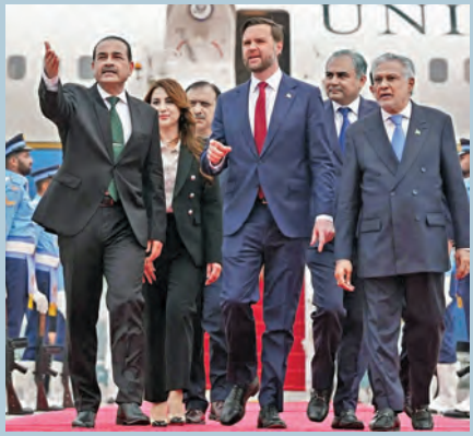
శనివారం ఇస్లామాబాద్ చేరుకున్న జెడిఎస్ బృందం ఇస్లామాబాద్, ఏప్రిల్ 11: ఇరాన్ పై యుద్ధం ముగింపు కోసం అమెరికా, ఇరాన్ దేశాలమధ్య జరుగుతున్న శాంతి చర్చల్లో పురోగతి కనిపించకపోయినా ఒకరి డిమాండ్ వార్షిక మరొకరు పంపకున్నారు.

ఇస్లామాబాద్ లో 'అమెరికా, ఇరాన్ మధ్య తొలిరోజు నాలుగు గంటలు చర్చలు పాక్ ప్రధాని షేహబాజ్ షరీఫ్ మధ్యవర్తిత్వం స్తంభించిన ఆస్తులు, నిధులు విడుదల చేయాలని ఇరాన్ డిమాండ్ కొత్త షరతులతో ముందుకు సాగని చర్చలు హార్డుకోపై కొనసాగుతున్న ప్రతిష్టంభన