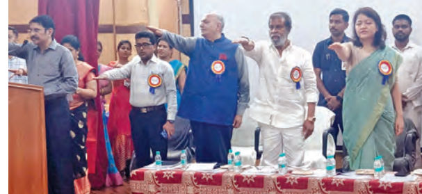
డ్రగ్స్ అమ్మడం, వాడకం ప్రమాణం చేయిస్తున్న ఆరోగ్యశాఖ మంత్రి దామోదర రాజనల్లింపా

హైదరాబాద్ (సికిందరాబాద్), ఏప్రిల్ 11, ప్రభాతవార్త: డ్రగ్స్ వాడకం వలన వ్యక్తి గత జీవితంలో తపోపాటు సామాజిక జీవితాన్ని కోల్పోతామని, ఉజ్వలమైన భవిష్యత్తు కూడా నాశనమవుతుందని వైద్య, ఆరోగ్య శాఖ మంత్రి దామోదర రాజనల్లింపా అన్నారు. గాంధీ దవాఖాన సైకియాట్రి విభాగంలో 20 డిజిజిత ఏర్పాటు చేసిన సూతన డ్రగ్స్ డిఆడిక్షన్ కేంద్రాన్ని ఆయన ముఖ్యఅతిథిగా హాజరై ప్రారంభించారు. అనంతరం ఔషధ నియంత్రణ పరిపాలన శాఖ అధ్యక్షులతో శనివారం గాంధీ మెడికల్ కాలేజీ ఆలుమ్ని అడిటోరియంలో ప్రజా పాలనప్రగతి ప్రజాశక్తి కార్యక్రమంలో భాగంగా అలవాటుగా మారే ఔషధ దుర్వినియోగం అడగడానికి శిబిరం నిర్వహించారు. ఈ సందర్భంగా ఆయన మాట్లాడుతూ డ్రగ్స్ ఖాసిన పడిన వారి కోసం సందర్భంగా మంత్రి మాట్లాడుతూ.. ప్రస్తుతం రాష్ట్రంలో 35 డిఆడిక్షన్ కేంద్రాల ఏర్పాటు చేశామని అన్నారు. వారికి స్ట్రీనింగ్, కౌన్సిలింగ్, చికిత్స అందించి వారిని సాధారణ స్థాయికి తీసుకురావడానికి చేస్తున్నామని చెప్పారు. చట్టాల వారా కఠినంగా ఉన్నా డ్రగ్స్ వినియోగం పెరుగుతుండడం బాధాకరమని అన్నారు. డ్రగ్స్ అమ్మడం, వాడడం నేరమని వైద్య విద్యార్థుల చేత ప్రతిఘటించాలన్నారు. అవగాహన పోస్టర్లను విడుదల చేశారు. వ్యాస రచన పోటీల విజేతలకు ప్రశంసాపత్రాలు, బహు అద్యక్షులతో శనివారం గాంధీ మెడికల్ కాలేజీ ఆలుమ్ని అడిటోరియంలో ప్రజా పాలనప్రగతి ప్రజాశక్తి కార్యక్రమంలో భాగంగా అలవాటుగా మారే ఔషధ దుర్వినియోగం అడగడానికి శిబిరం నిర్వహించారు. ఈ సందర్భంగా ఆయన మాట్లాడుతూ డ్రగ్స్ ఖాసిన పడిన వారి కోసం సందర్భంగా మంత్రి మాట్లాడుతూ.. ప్రస్తుతం రాష్ట్రంలో 35 డిఆడిక్షన్ కేంద్రాల ఏర్పాటు చేశామని అన్నారు. వారికి స్ట్రీనింగ్, కౌన్సిలింగ్, చికిత్స అందించి వారిని సాధారణ స్థాయికి తీసుకురావడానికి చేస్తున్నామని చెప్పారు.